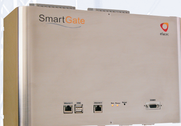
SmartGate apresentado em caixa de aço inoxidável

A Efacec, em linha com a estratégia tecnológica que tem vindo a conduzir desde 2006, com o objectivo de dar resposta aos mais recentes desafios energéticos e ambientais, desenvolveu uma gama de soluções para Smart Grids , designada por: SmartPower